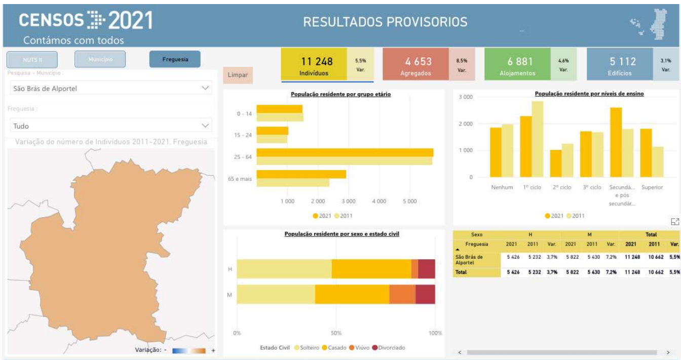
Figura 2 Resultados provisórios Censos 2021