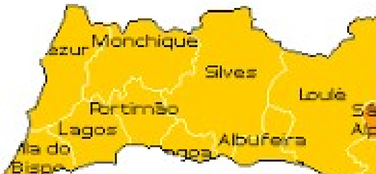
Figura 1 Localização de São Brás de Alportel no Algarve

O concelho de São Brás de Alportel, de freguesia única, a qual corresponde à área urbana da vila com o mesmo nome, nasceu a 1 de junho de 1914, dia em que se comemora o seu feriado municipal. Apesar de ser um pequeno concelho do interior algarvio, não muito distante do mar, tem como concelhos limítrofes Faro e Olhão a sul, Tavira a Este e Loulé a Oeste, beneficiando assim de uma boa centralidade geográfica e económica (Fig. 1).